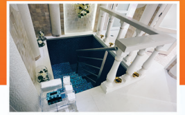
En images : le nouveau Mikvé de Bry-sur-Marne

La validité des Mikvaot est sous l'entière responsabilité du Rabbin de la communauté qui en a la charge